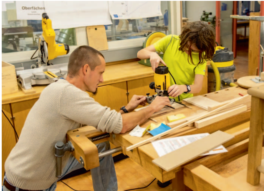
Schulanlage Reuteneu - Werken