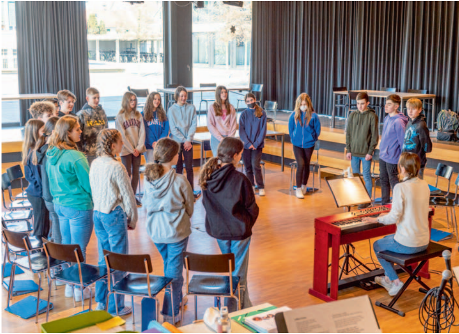
Schulanlage Ost · Musik