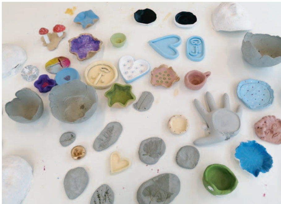
Schulanlage Auen - Kunst