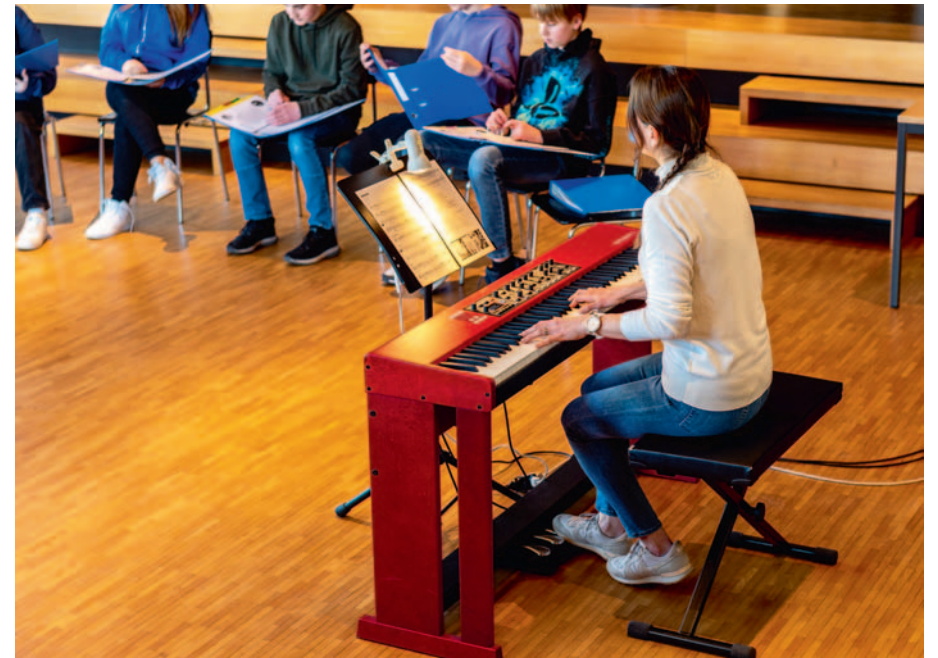
Schulanlage Ost · Musik