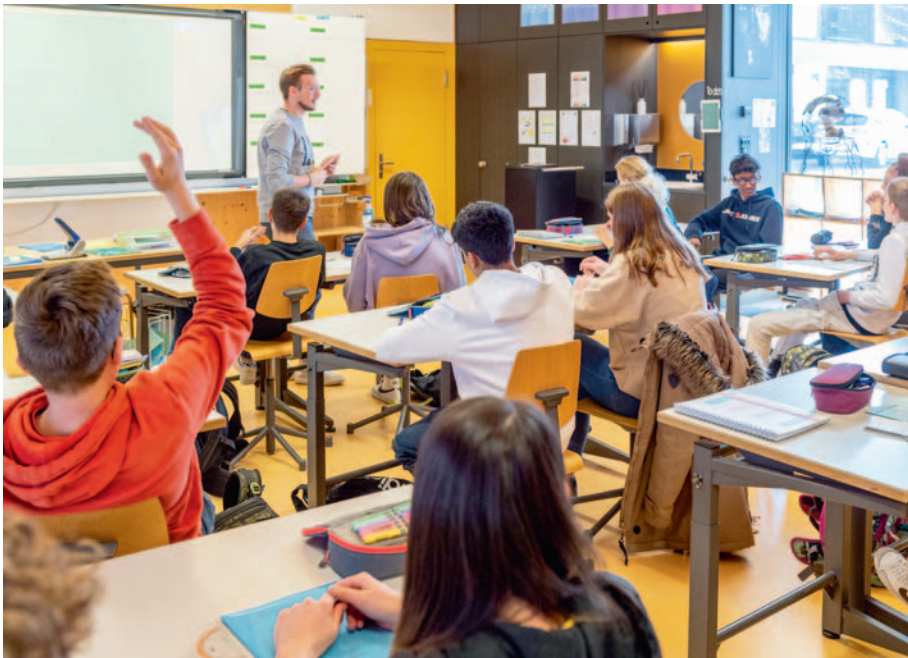
Schulanlage Ost · Berufswahl