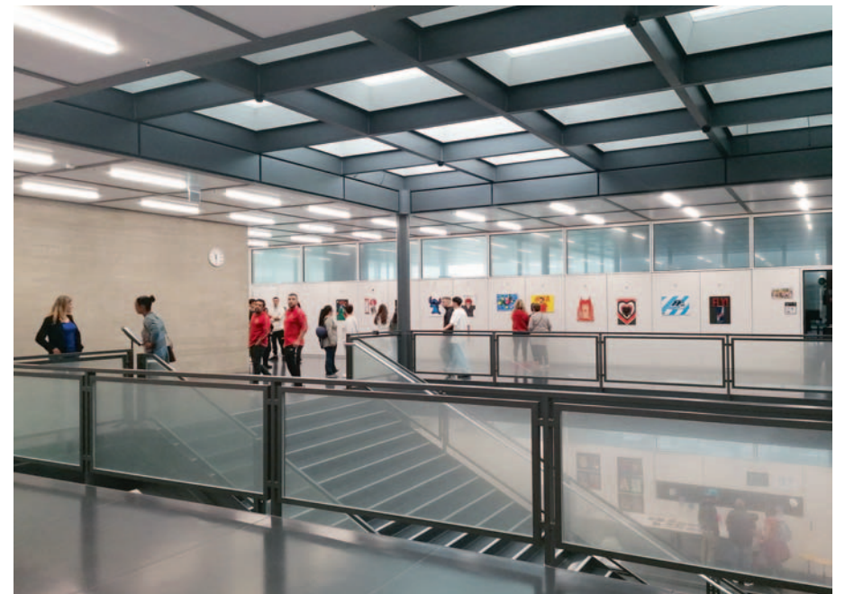
Schulanlage Auen - Treppenhaus