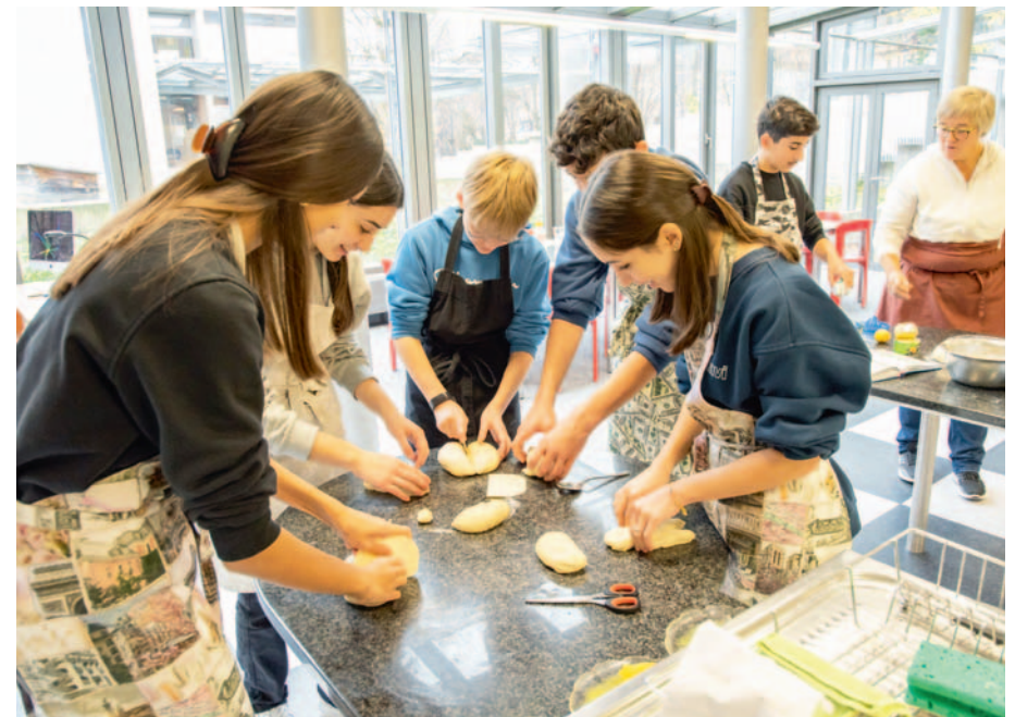
Schulanlage Reutenen · Backen