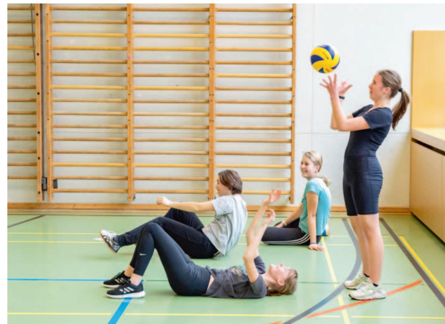
Schulanlage Reutenen · Volleyball