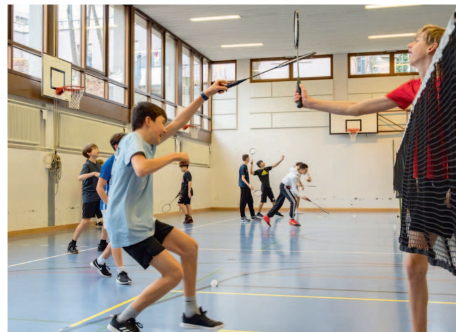
Schulanlage Reutenen · Badminton