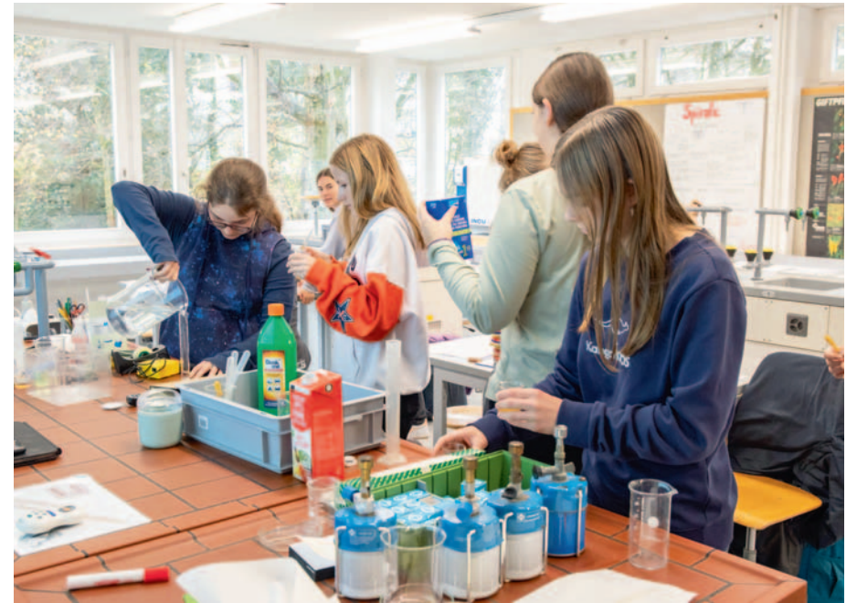
Schulanlage Reuteneu - Chemie