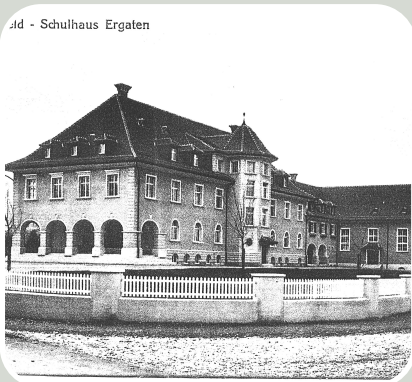
id - Schulhaus Ergaten

100-Jahr Jubiläum Ergaten: 25. / 26. Juni 2021!