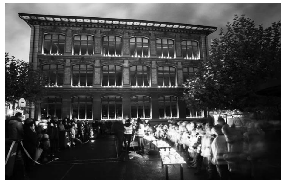
Schulanlage Spanner, Räbeliechtli