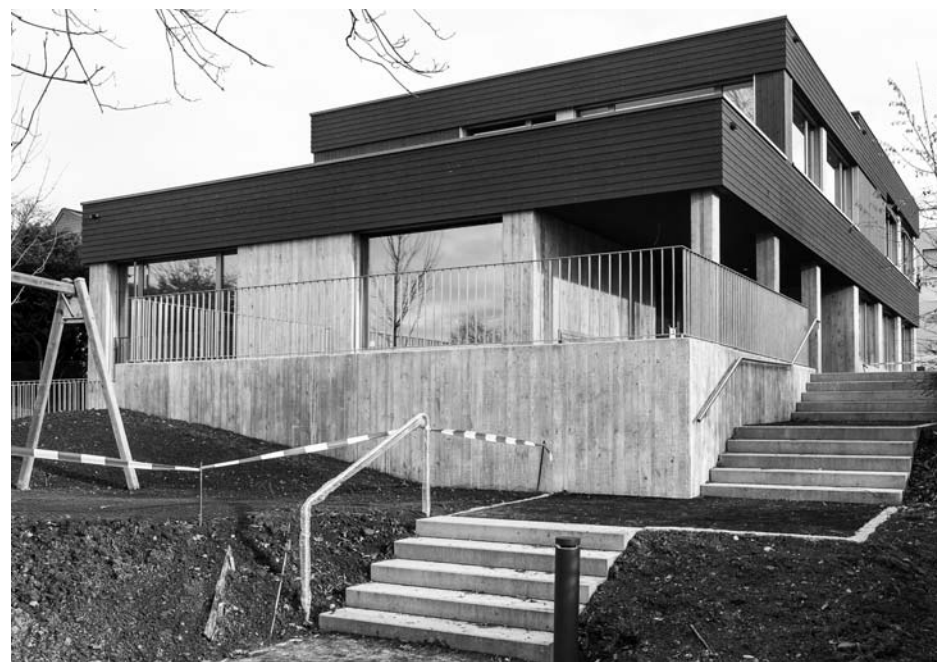
Neubau Kindergarten Brotegg, Westansicht, 2019