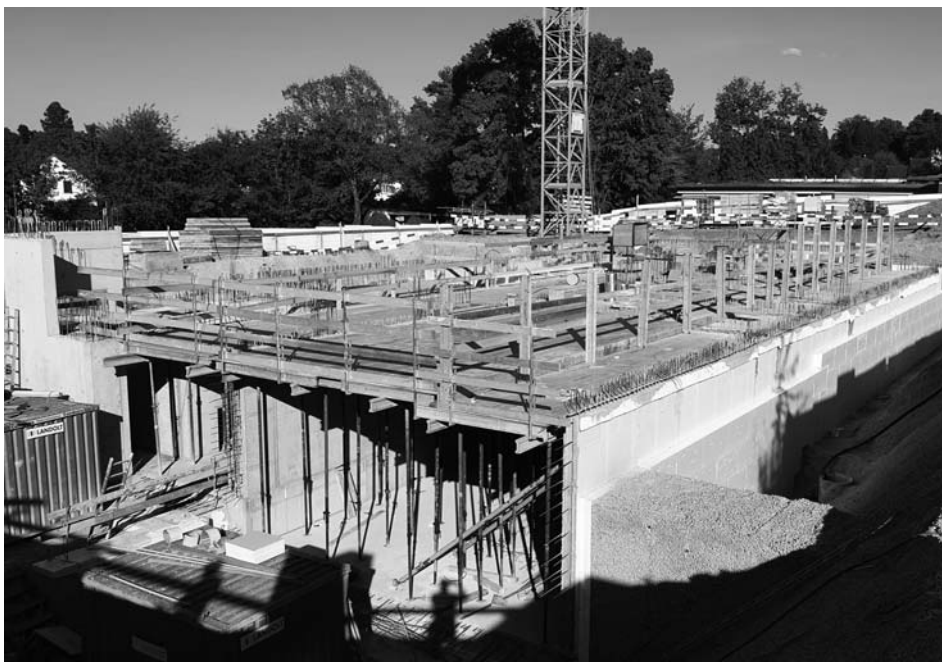
Schulanlage Schollenholz, Neubau, April 2020