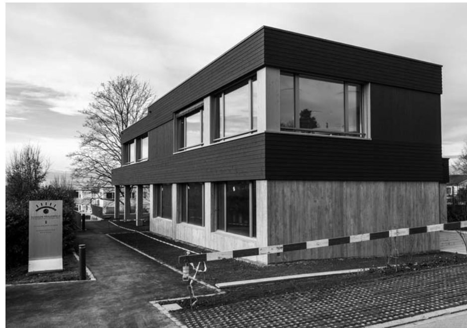
Neubau Kindergarten Brotegg, Ostansicht, 2019