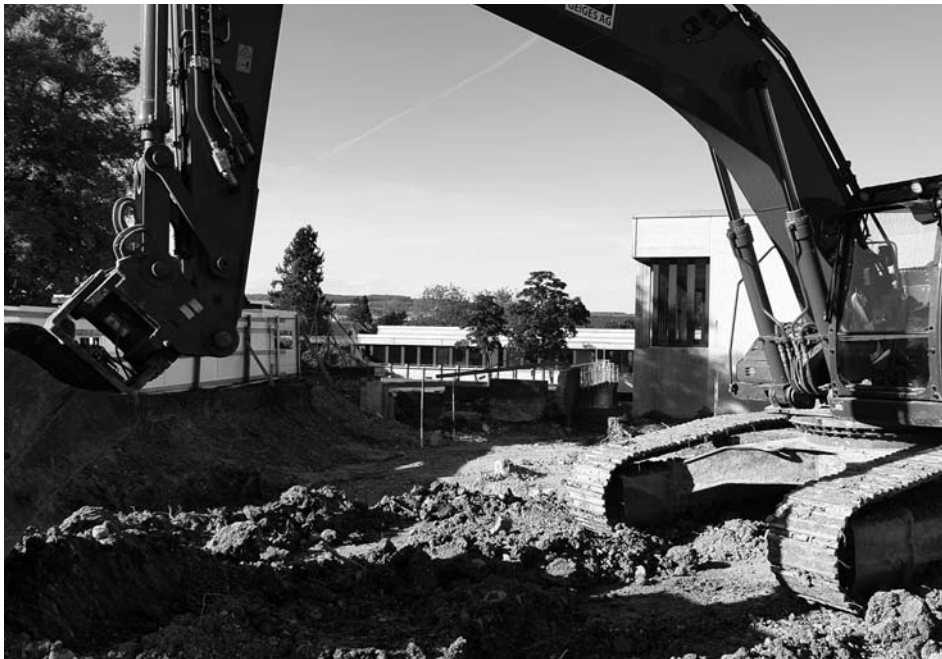
Schulanlage Schollenholz, Bauarbeiten, 2020