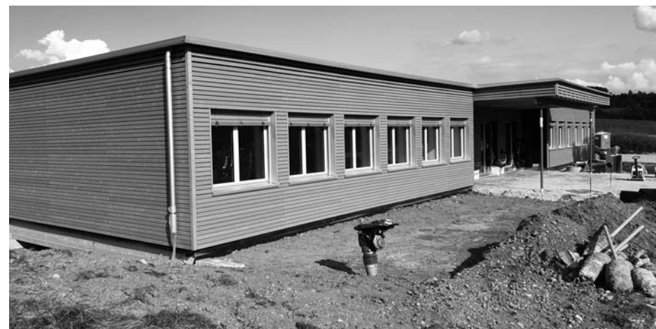
Pavillon Huben Sommer 2019